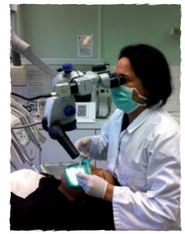
Le Centre de Soins Dentaires, terrain de stage des étudiants et praticiens en formation.

Formation continue diplômante - 3 Diplômes d'Université - 7 CES