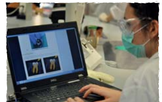
Le numérique au service de la formation : cours et ressources en ligne, tableau blanc interactif, boîtier numérique de vote...